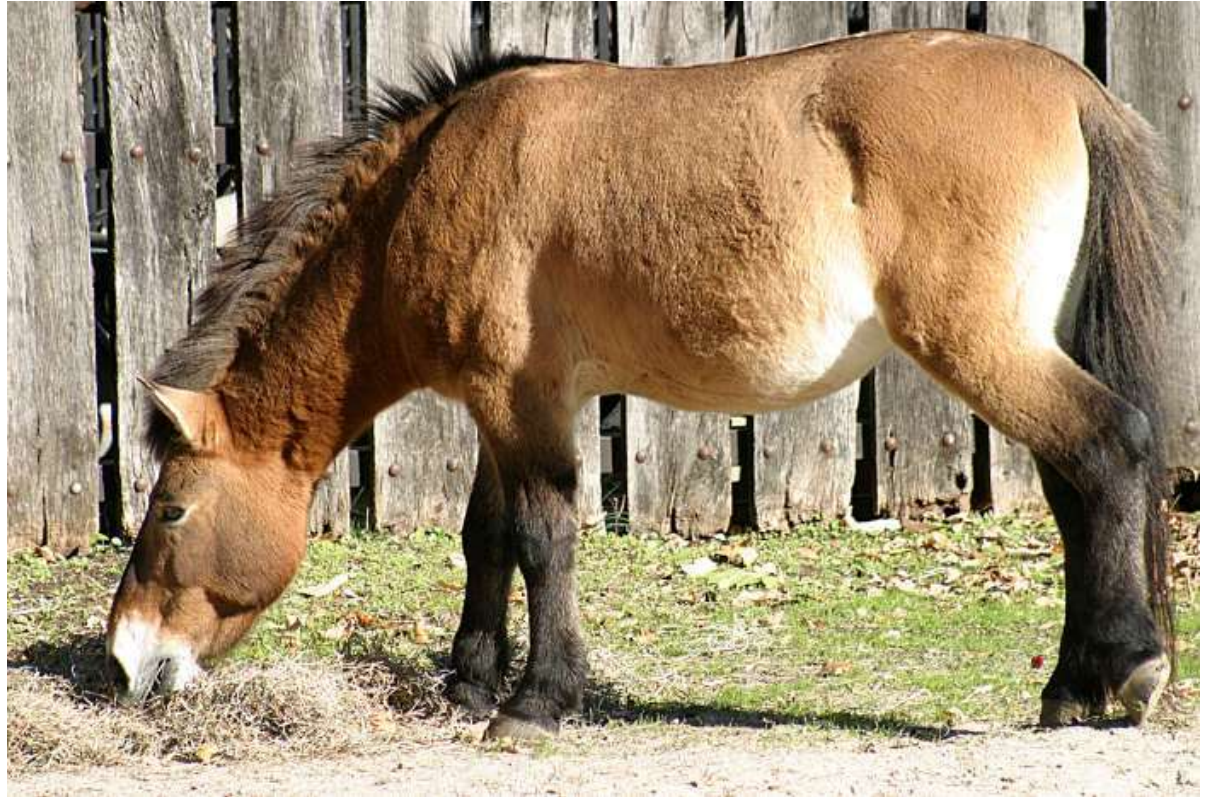
Kůň Převalského – polopouště Mongolska a Číny