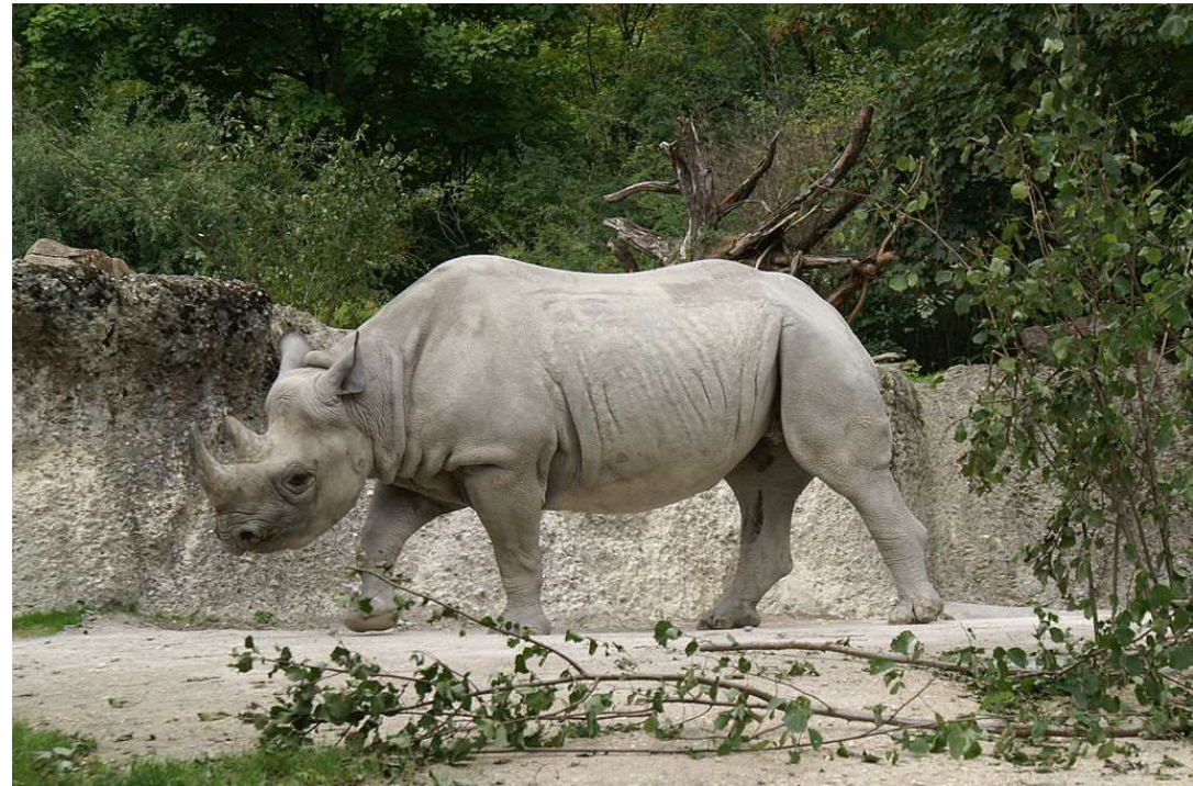
Nosorožec dvourohý – africké savany